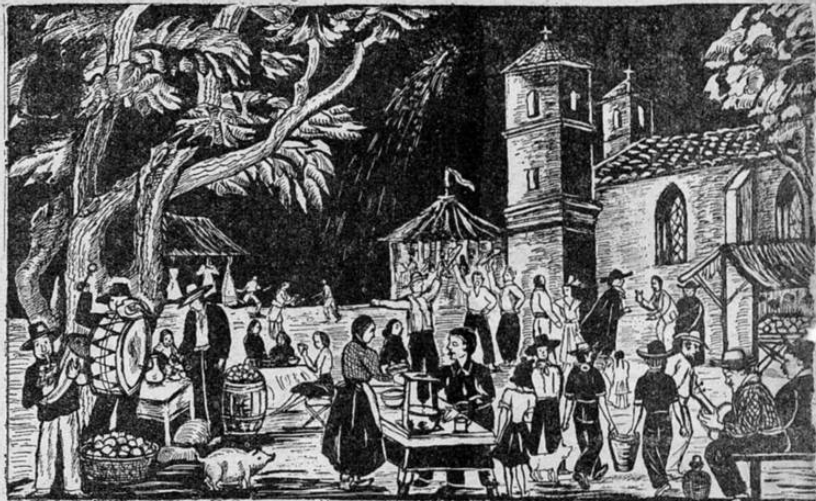
La fiesta del Santo Patrono con gran derroche de música y alegría